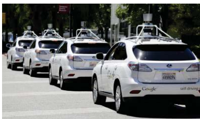
Zelfrijdende auto's (meer fabrikanten)