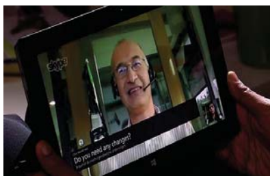
Live vertaling (Skype 2015)