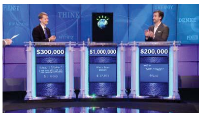
Jeopardy gewonnen door Watson (IBM 2013)